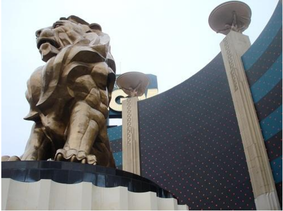
هذا الاسد ضخم جدا وهو التمثال خارج الفندق