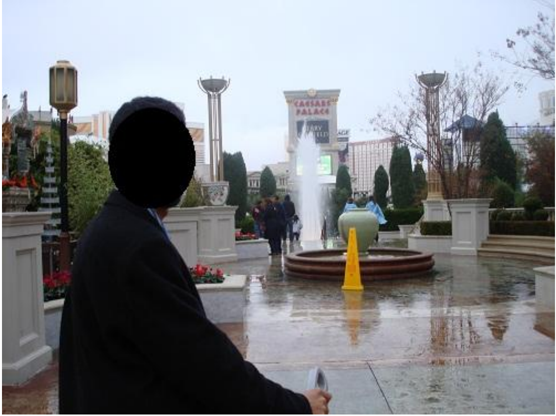
رايحين فندق قصر القيصر