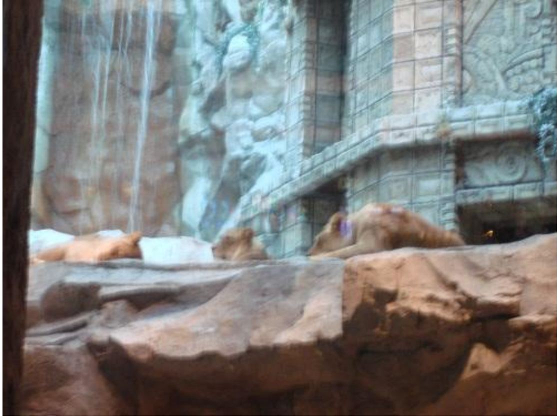
قفص الأسود في الفندق طبعاً