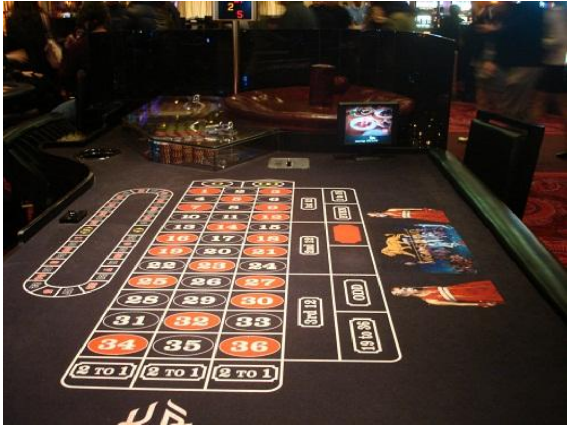
صور الفندق لما الحين ما خلصنا