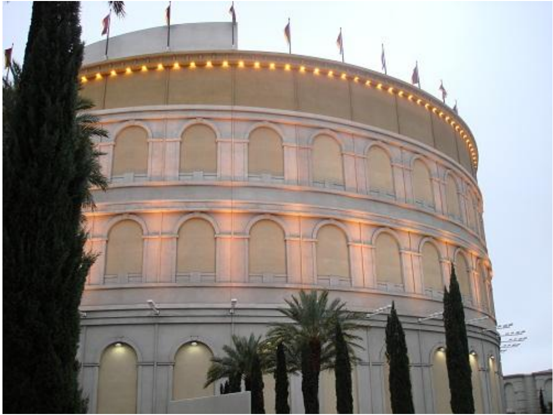
تابع الفندق قصر القيصر المسرح الروماني