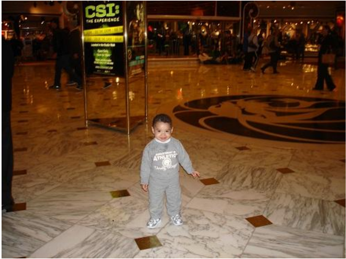
هذا اللوبي وبداية البوابة للفندق