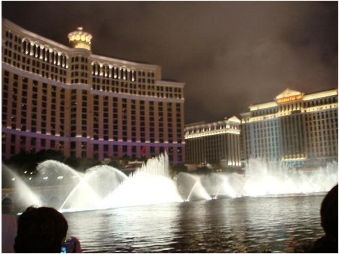
وصلنا واخيرا بس على نهايتها