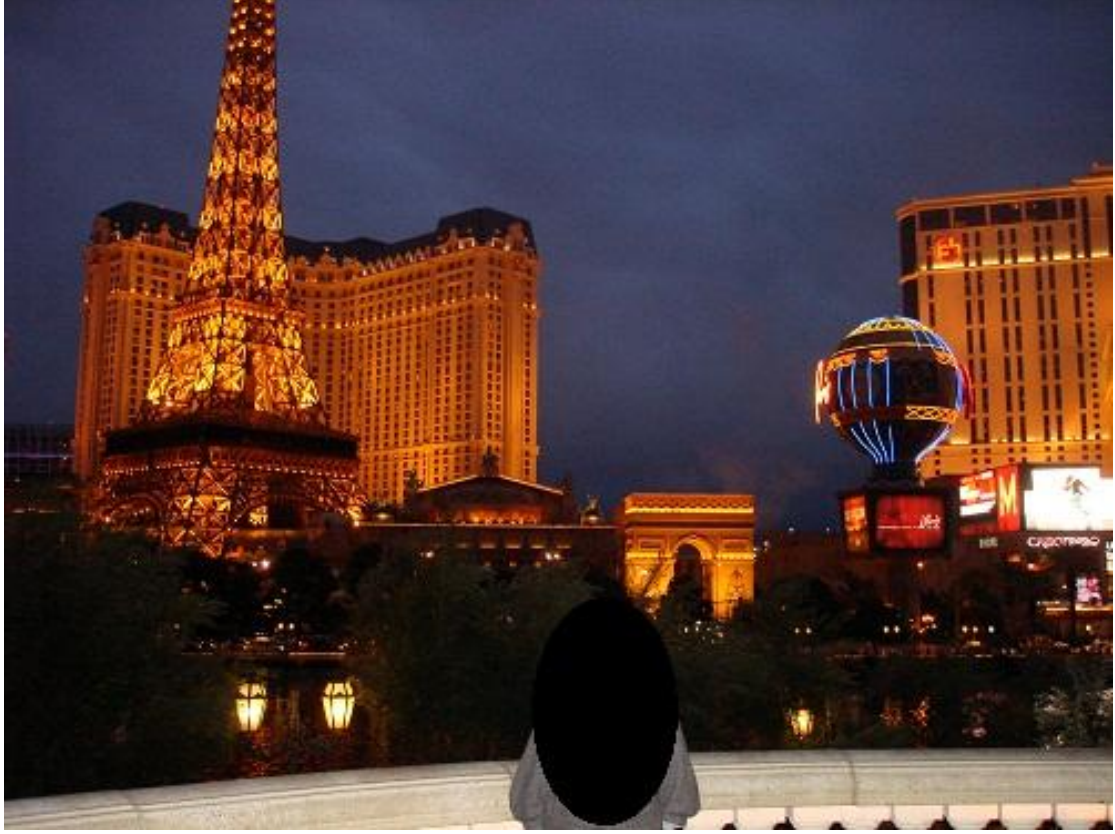
حديقة الفندق والنافورة المشهور